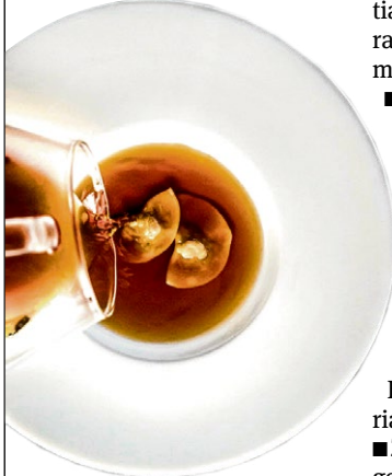
Die Ravioli mit geschmorter Gans sind ein Renner im Mesa.

■ Die Gans in einen Bräter geben und im Ofen bei niedriger Temperatur (80 Grad) für circa