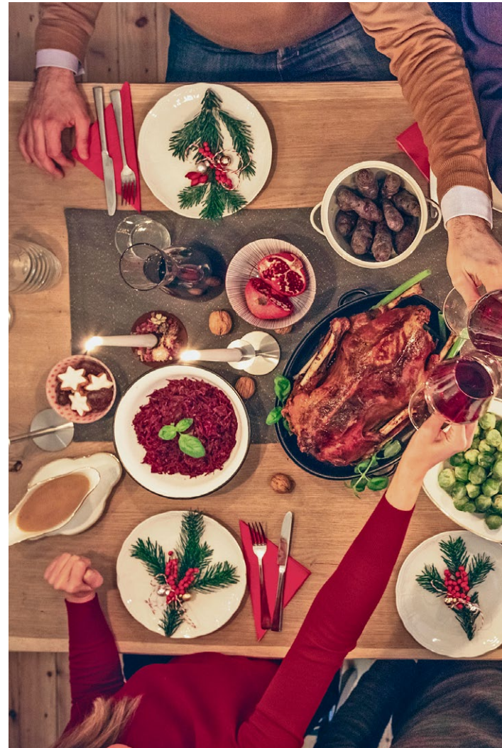
Eine ganze Gans auf der festlich geschmückten Weihnachtstafel sieht