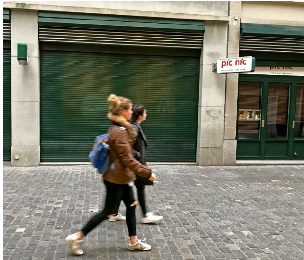
Aus Picnic wird schon bald Pic-Chic: Anfang März gehts los.