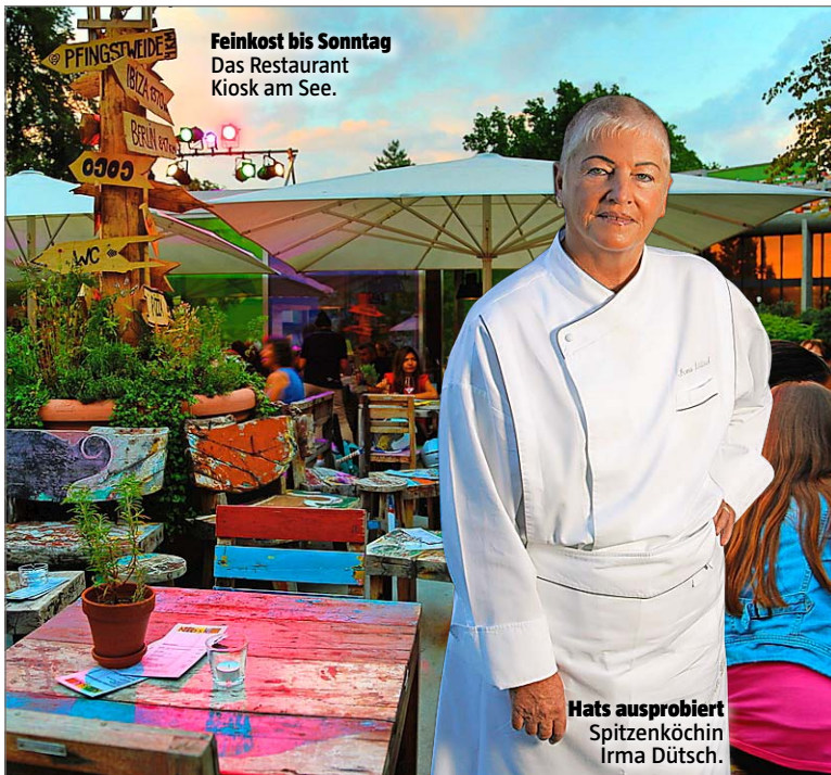
Feinkost bis Sonntag Das Restaurant Kiosk am See.

«Es scheint momentan so, dass die neue Domain nur innerhalb der Kantons Grenzen vergeben wird und Einzelpersonen nicht zum Zug kommen dürften», sagt Sprecher Can Arian. Bis im Herbst soll die Vergabe geregelt sein. «Beispielsweise müssen wir noch klären, inwieweit das Prinzip «first come, first served» gelten wird oder ob Domain-Auktionen eine Option sind.» gpr