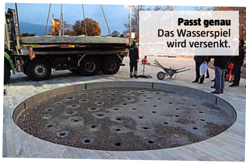
Passt genau Das Wasserspiel wird versenkt.