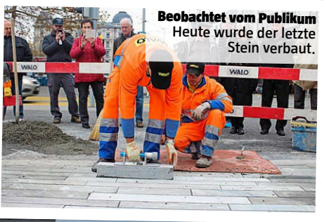
Beobachtet vom Publikum Heute wurde der letzte Stein verbaut.